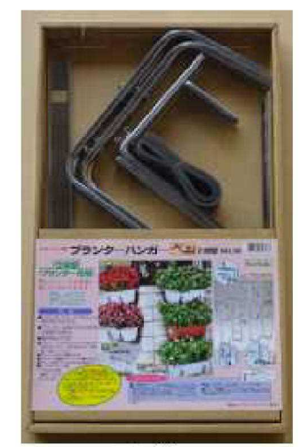
No.98 ステンプランター ハンガーベン2段型