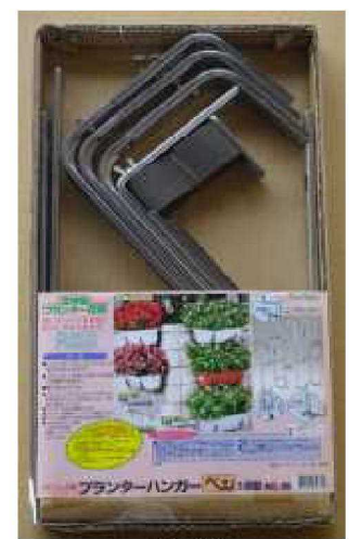
No.99 ステンプランター ハンガーベン3段型