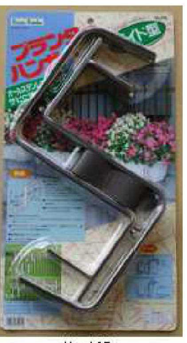
No.105 ステンプランター ハンガーワイド型