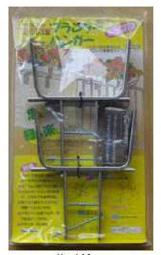
No.102 ステンプランター ハンガートップ型