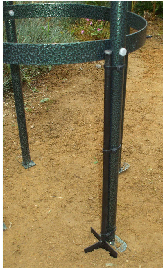
取り付け完了イメージ