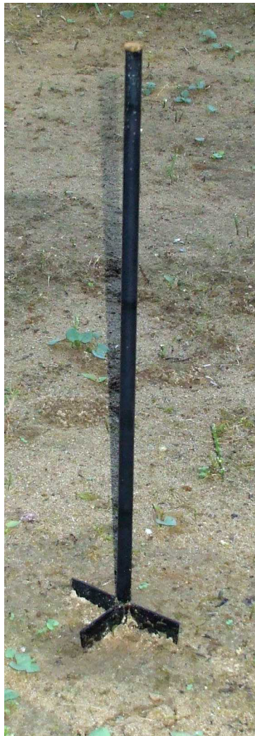
羽根付杭を打ち込んだ状態